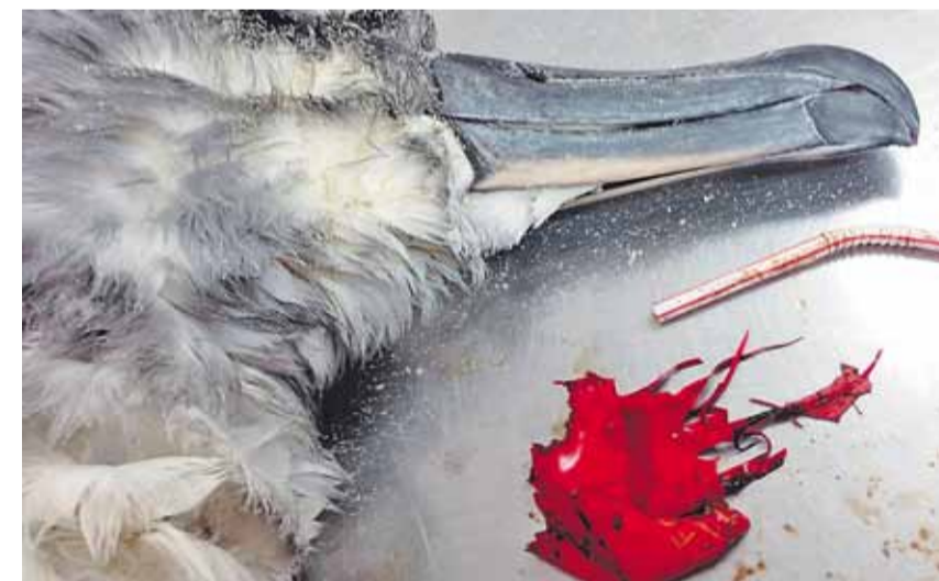
Restos plásticos extraídos del cadáver de un albatros