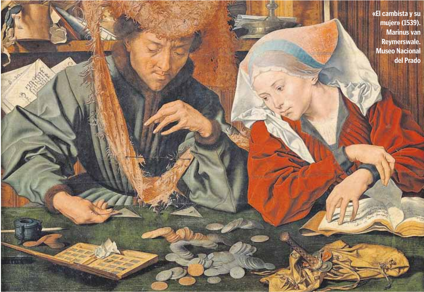
«El cambista y su mujer» (1539). Marinus van Reymerswale. Museo Nacional del Prado