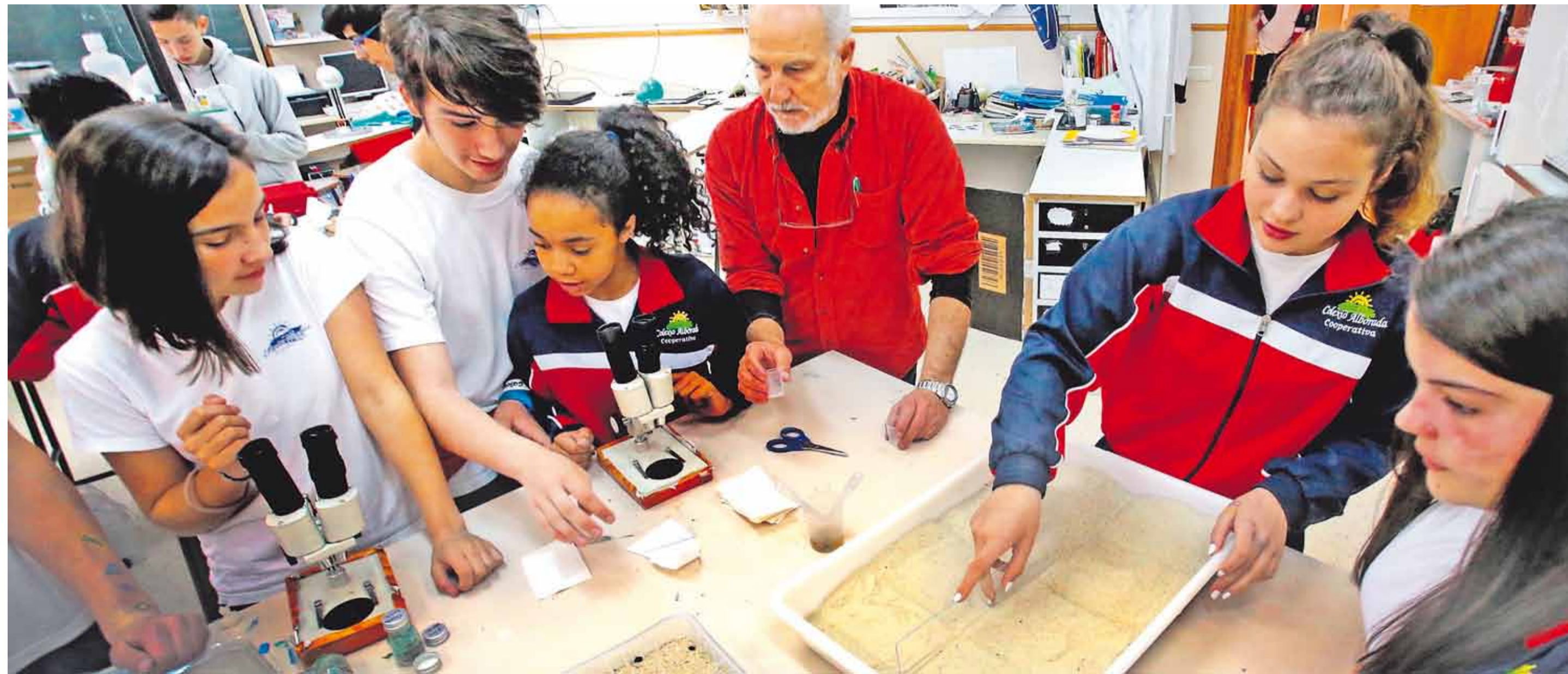
El primer paso del proyecto Libera para librar de plásticos el planeta es conocer. En la imagen, alumnos y profesor del colegio Alborada desarrollan un proyecto para observar los microplásticos presentes en la ría de Vigo