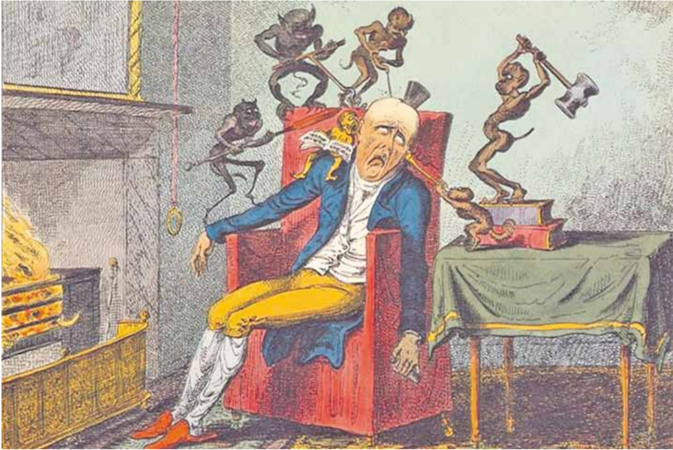
«El dolor de cabeza», por George Cruikshank. Viñeta publicada el 12 de febrero de 1819