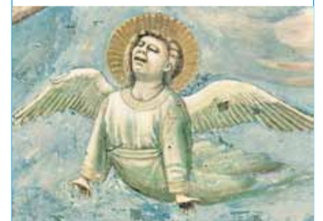
Uno de los ángeles del fresco «Lamentación sobre Cristo muerto» (1305-1306), Giotto. Capilla de los Scrovegni, Padua

4 En un dibujo del cuerpo humano, indica el lugar que corresponde a cada uno de los siguientes dolores: cefalea, lumbalgia, cólico nefrítico, dolor abdominal, dolor renal, dolor pectoral.