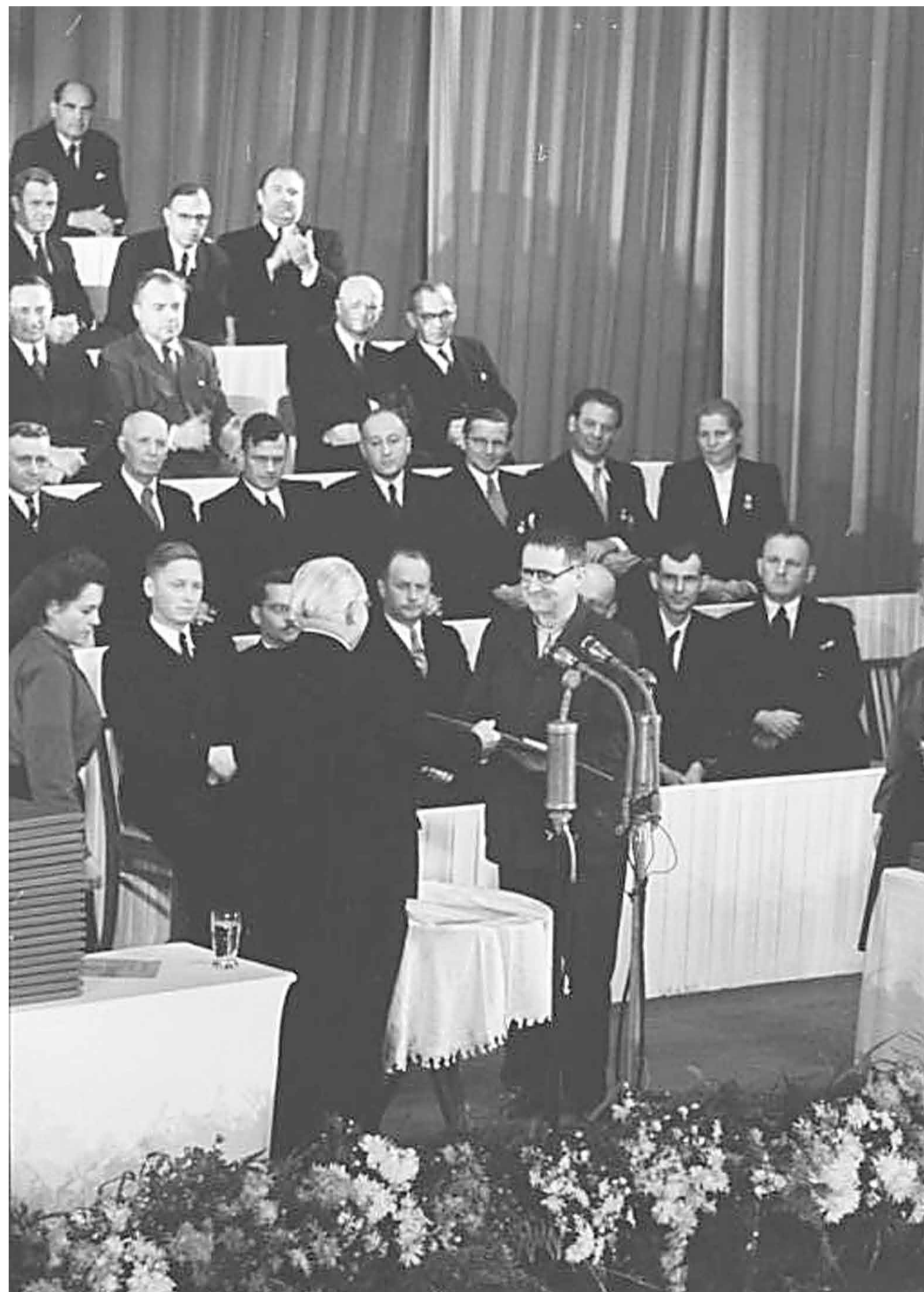
Bertolt Brecht recibiendo el premio nacional en Berlín, en 1952

Hasta la legendaria Atlántida, la noche en que el mar se la tragó, los que se ahogaban pedían, bramando, ayuda a sus esclavos. El joven Alejandro conquistó la India. ¿Él solo? César venció a los galos. ¿No llevaba siquiera a un cocinero? Felipe II lloró al saber su flota hundida. ¿No lloró más que él? Federico de Prusia ganó la Guerra de los Treinta Años. ¿Quién ganó también? Un triunfo en cada página. ¿Quién preparaba los festines? Un gran hombre cada diez años. ¿Quién pagaba los gastos? A tantas historias, tantas preguntas. (A los hombres futuros)