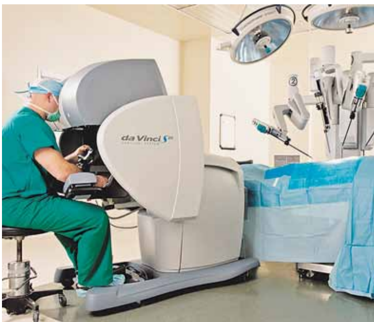
Os robots cirurxiáns coma o Da Vinci funcionan grazas á baixa latencia da rede 5G

Seguro que algunha vez, ao falar por teléfono, notamos o incómoda que é unha liña que ten retardo, e o tempo que se perde para lograr entenderse. Con baixa latencia, a sincronización é perfecta, e así é posible interpretar un concerto cos músicos repartidos por todo o mundo ou realizar operacións