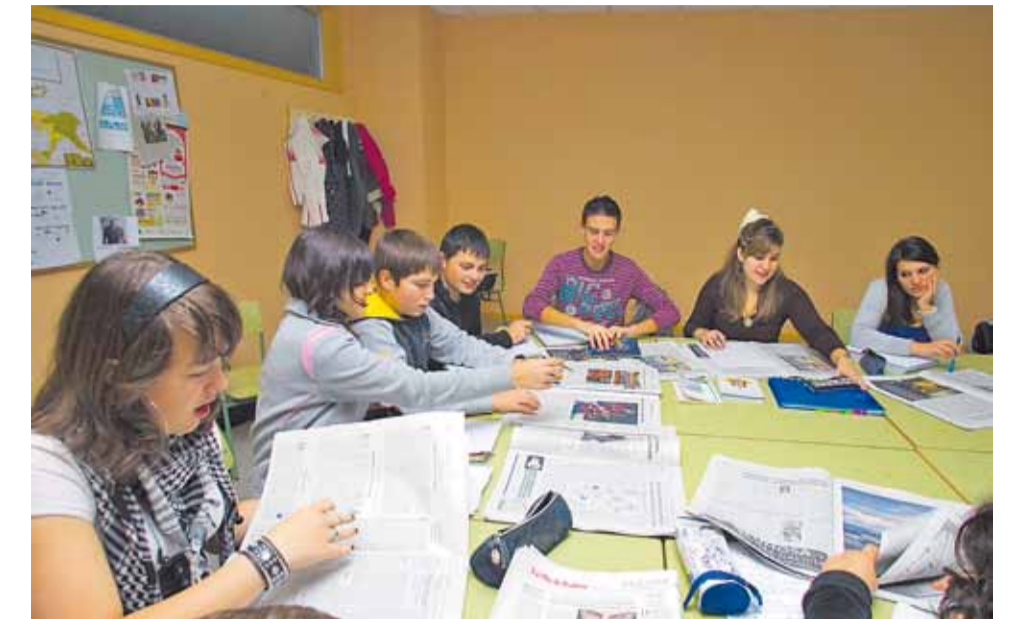
El uso del periódico en el aula facilita el desarrollo de actitudes y destrezas y la inserción en grupos y servicios sociales

■ Alumnos de 3.º, 4.º, 5.º y 6.º de primaria y de educación especial. La noticia que elijan deberá estar redactada como si se la estuvieran contando a un amigo, y no copiada textualmente del periódico. También se tendrá muy en cuenta la originalidad y calidad del dibujo. Por eso no es buena idea calcar dibujos o fotografías, es mucho