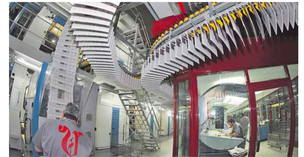
La rotativa de Sabón: aquí empieza el periódico a llegar a tu clase