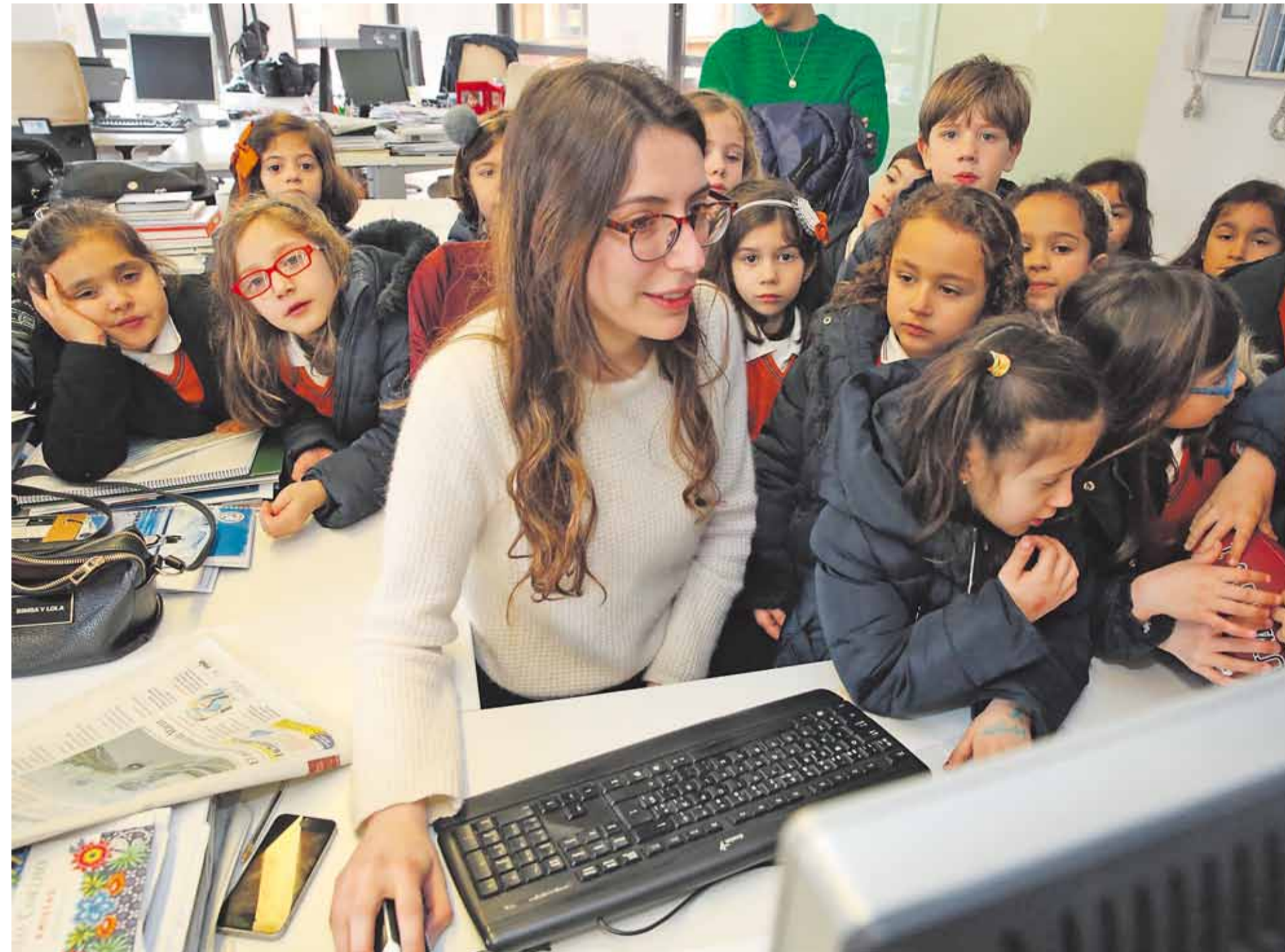
Visita de alumnos del colegio San Francisco a las instalaciones de La Voz de Galicia en Arousa, el año pasado con motivo de la Semana de la Prensa en la Escuela

■ La noticia del día. Es la noticia que Prensa-Escuela publica de lunes a viernes y, además, te da una pista de cómo tratarla, aplicarla y estudiarla mejor en el aula: www.prensaescuela.es