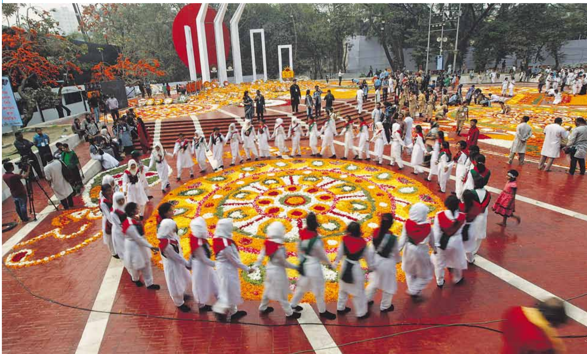
MEHEDI HASAN / EFE