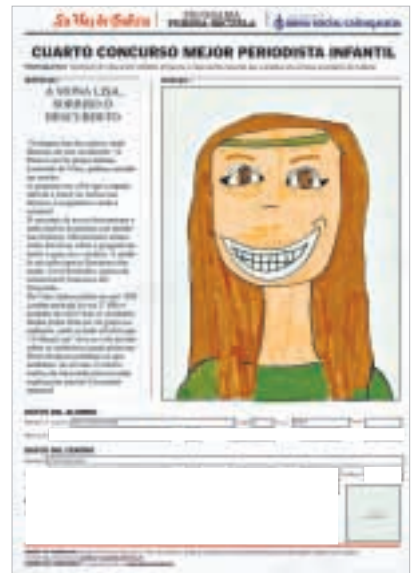
«A MONA LISA. SORRISO Ó DESCUBERTO. O enigma dun dos cadros máis famosos da arte occidental, A Mona Lisa...»