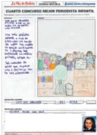
«UNA SOLA PEDIATRA ATIENDE A MÁS DE MIL NIÑOS EN AS PONTES SIN AYUDA»