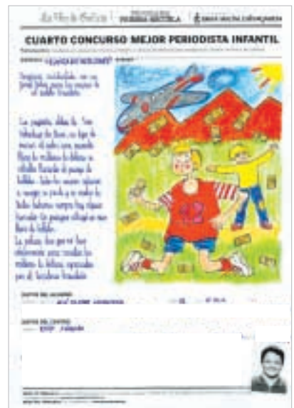
«LUVIA DE MILLONES. Sorpresa accidentada con un final feliz para los vecinos de un pueblo brasileño»