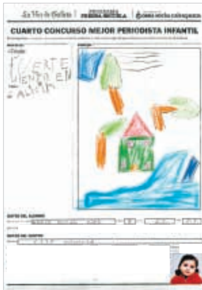
«FUERTE VIENTO EN GALICIA»