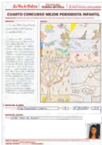
«O CAMBIO CLIMÁTICO CAUSADO POLO HOME É ACELERADO. O alarmante cambio climático que sufriremos no noso planeta...»