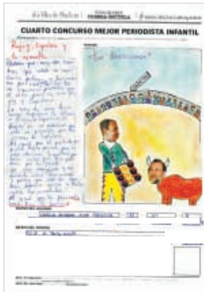
«RAJOY, ZAPATERO Y LA REVUELTA. ¿Sabías que hay dos hombres que están en constantes peleas y discusiones...?»