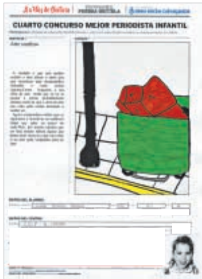
«ARTE CONFUSO. A verdade é que non puiden ocultar o meu abraío ó saber que uns varredores algo despistadiños...»