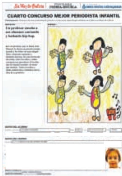
«UN PROFESOR ENSEÑA A SUS ALUMNOS CANTANDO Y BAILANDO HIP-HOP»