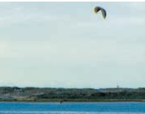
Arriba a la izquierda, un chorlitejo negro y, a su derecha, un chorlitejo grande y una nutria. En la siguiente fila, una pareja de espátulas en la ría de O Burgo y una vista de Valdoviño. Abajo, un serreta y, al lado, práctica del «kitesurfing» en Baldaio. Puedes ver estas imágenes, algunas más y obtener mucha más información sobre ornitología en el blog: http://avesdelariadoburgo.blogspot.com