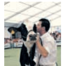
Vacas e bacas non son a mesma cousa

■ A ortografía é fundamental nun idioma: fíxate que non é igual escribir en español «huevos» que «uebos». Nin en galego ou español «vacca» que «baca». Nin «bacilo» que «vacilo». Son verbos homófonos: soan igual, pero non significan o mesmo. ¿Lembras algunhas outras?