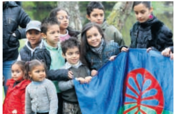
Unos niños sostienen con orgullo la bandera gitana