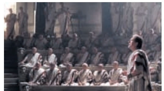
Recreación cinematográfica de Cicerón disertando no Senado romano

A errata máis sinxela converte a unha muller ruesa (da Rúa, Ourense) en natural dun país afastado: «La rusa M. D., subcampeona gallega de ciclismo». Hai máis dunha década unha moi seria comisión interuniversitaria anunciaba a matrícula da selectividade para «los días 30 y 31 de abril», sen comprobar antes no calendario que ese mes non ten 31, e unha seria axencia de noticias pasaba un despacho convocando un