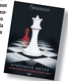
«Amanecer» es el cuarto título de la serie