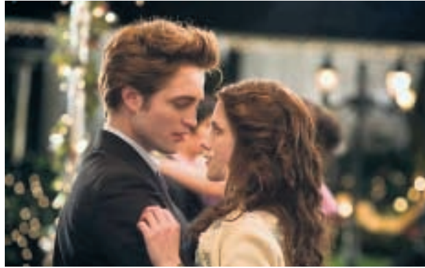
El amor que une a Edward y Bella es el hilo conductor de los libros de Meyer

A menudo se pone en entredicho la calidad literaria de unas novelas que han dado pie a grandes taquillazos en la gran pantalla, alimentan a diario las páginas de prensa rosa con detalles de la vida privada de